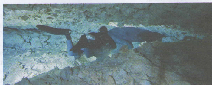
Sidemount configuración del equipo más avanzada con los dos tanques montados uno a cada lado del cuerpo para poder penetrar en lugares más estrechos.